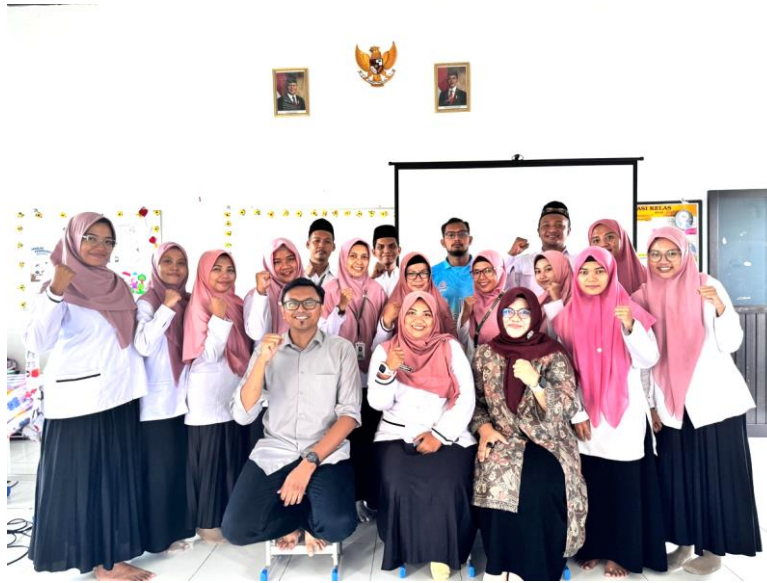
Gambar 3. Foto bersama Peserta Guru