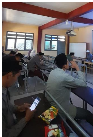
Gambar 2. Proses pelatihan media pembelajaran

Hasil ini menunjukkan bahwa pemanfaatan Canva memiliki potensi besar dalam meningkatkan kualitas pembelajaran di kelas.